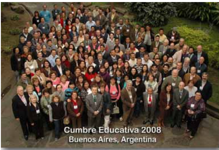
Cumbre Educativa 2008 Buenos Aires, Argentina

Las dinámicas de intercambio de ideas y de participación grupal de la serie de plenarias y talleres llegaron a su conclusión cuando los líderes representativos de cada país se abocaron a una declaración pública de compromiso. Esto ocurrió en cada sede de la Cumbre Educativa 2008. Se trataba de expresar nuestra disposición a ser agentes dinámicos para adecuarnos o responder a las nuevas necesidades de la iglesia y de los ministros actuales ante los cambios en la sociedad. El contenido de las Declaraciones de Compromiso representó el "momento cumbre de la Cumbre". Todos en unidad, presentamos delante de Dios nuestras vidas y recursos para recuperar nuestra identidad pentecostal y, como institución educativa, brindar un enfoque formativo integral, eficaz y actualizado para recuperar la relevancia de la Iglesia.